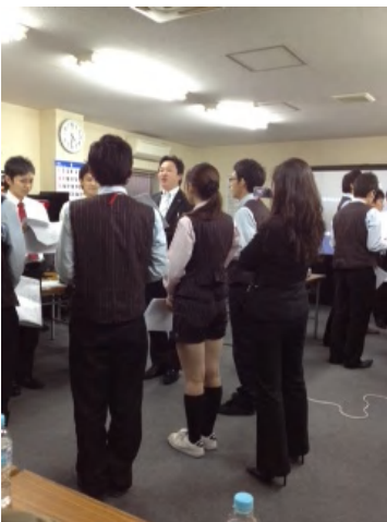
↑これは朝礼の模擬演習

そして、今年は大阪の企業の研修に参加しています。人材育成に力を入れておられる成果でしょう、研修会場に入るとき、社員、アルバイト、誰もが大きくハキハキとした声で、挨拶していきます。研修といえば、嫌々受ける受講者も見かけますが、全員が満面の笑顔でイキイキしていて、こちらが反対に元気にさせられました。