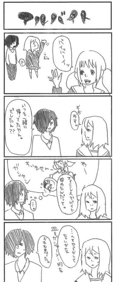
ゆいちゃん(大西の長女)は漫画を描くのが大好き 4コマ漫画担当です